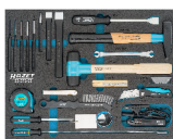
163-372/25 • ●